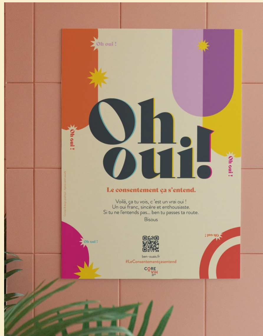
Affiches Lot de 4 déclinaisons