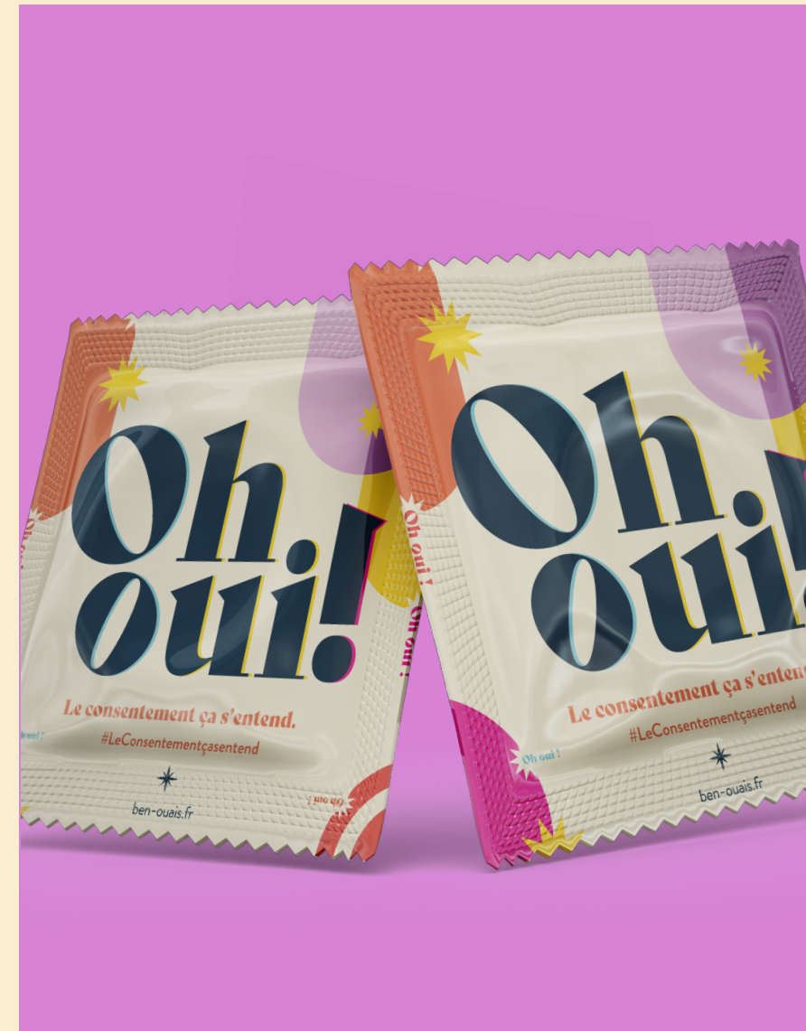
Préservatifs DUO pochettes cartonnées Photo non-contractuelle